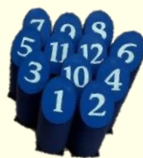
モルック(屋内) 2セット