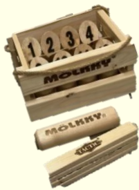
モルック(屋外) 2セット

昨年度、放課後子ども教室、放課後児童クラブでの活動、小学生のクラブ活動、PTA 親子活動、高校の探究活動、保小交流、自立活動など、幅広く活用してもらいました。どうぞお気軽にご利用、ご相談ください。